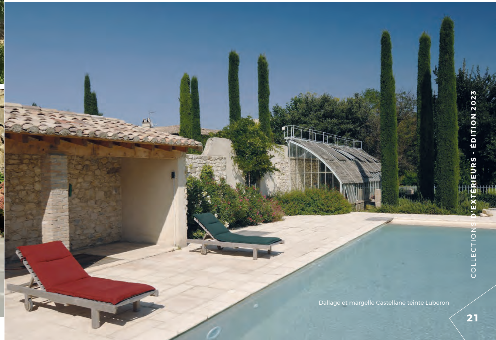
Dallage et margelle Castellane teinte Luberon