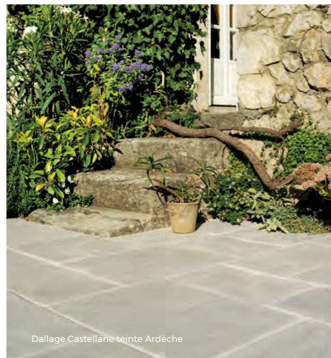
Dallage Castellane teinte Ardèche

JOINTS : jointer au mortier Fabjoint. Consommations et coloris en fin de catalogue.