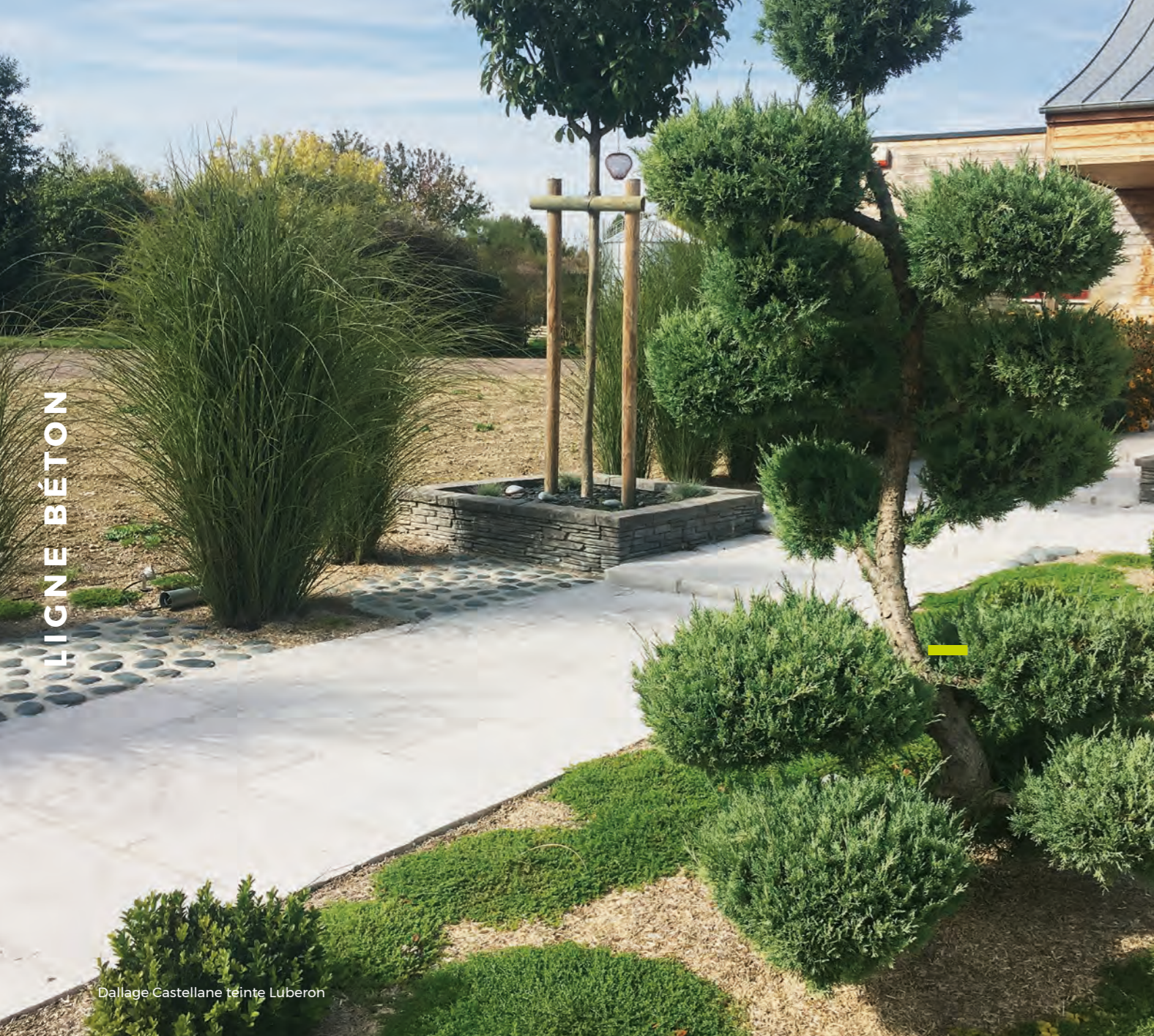
Dallage Castellane teinte Luberon