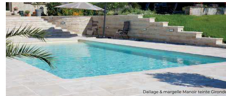
Dallage &amp; margelle Manoir teinte Gironde

PROTECTION & NETTOYAGE des dallages : il est recommandé de protéger vos surfaces. Retrouvez nos conseils en fin de catalogue.