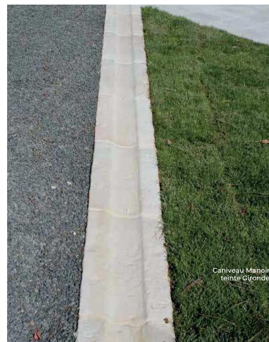
Caniveau Manoir teinte Gironde

Caniveau droit : 60 x 30 cm ép. 5 cm 21 u/palette