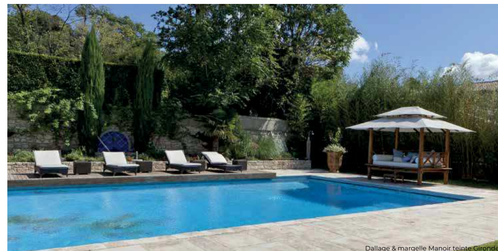
Dallage &amp; margelle Manoir teinte Gironde

Angle externe 90° 30 x 30 cm - 24 u/palette