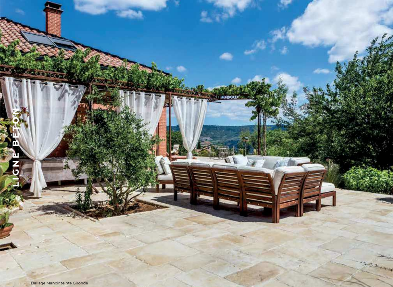
Dallage Manoir teinte Gironde