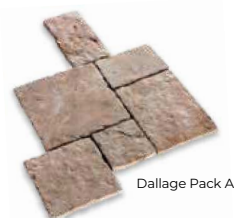
Dallage Pack A

Pack A 6 formats ép. 4 cm 30x30-45x30-45x45-60x45-60x30-60x60 cm 6,075m 2 /palette