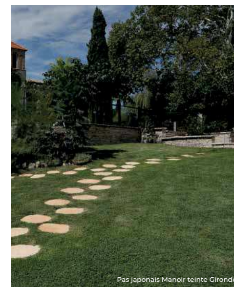
Pas japonais Manoir teinte Gironde