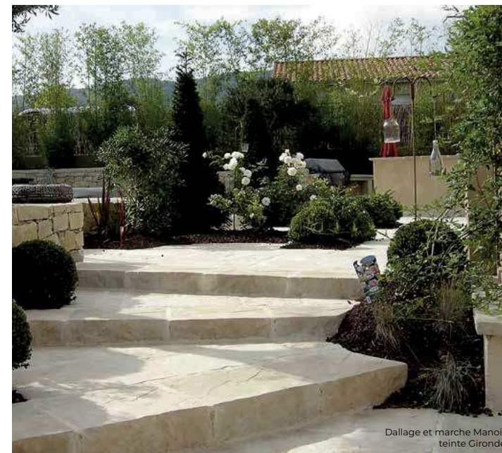
Dallage et marche Manoir teinte Gironde