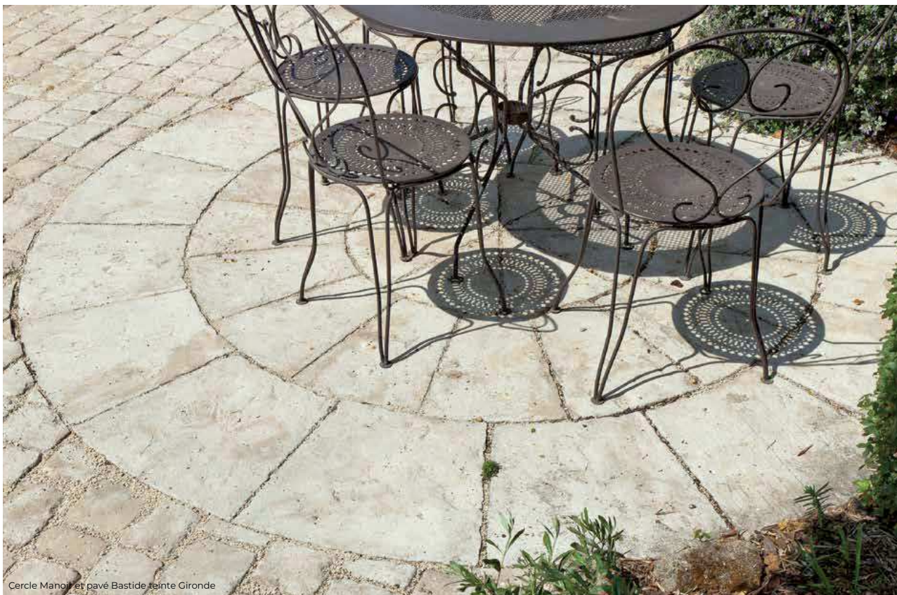
Cercle Manoir et pavé Bastide teinte Gironde