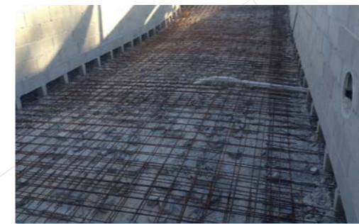
3 - Alphabloc associé aux blocs de coffrage enduits + ferrailage