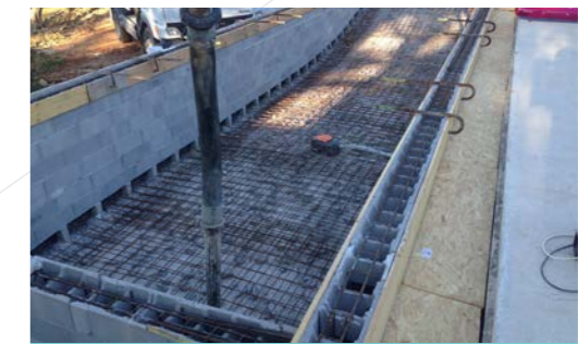
4 - Coulage du radier et murs en une seule opération