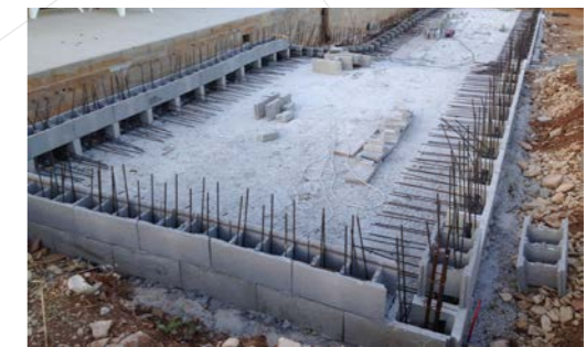
2 - Ferrailage