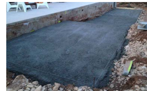
1 - Béton de propreté