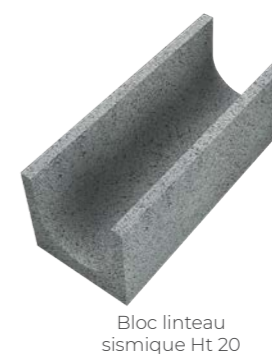
Bloc linteau sismique Ht 20