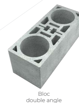
Bloc double angle