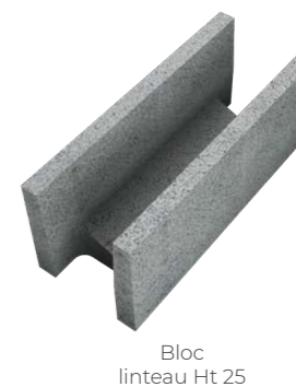
Bloc linteau Ht 25