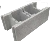
Bloc de 25 coupe