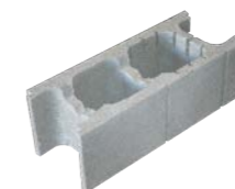
Bloc de 20 angle et coupe