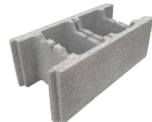
Bloc de 25 angle